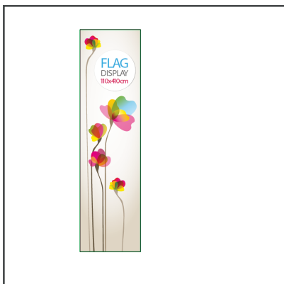
Fișier corect (doar grafică și bleeduri, neredimensionat).