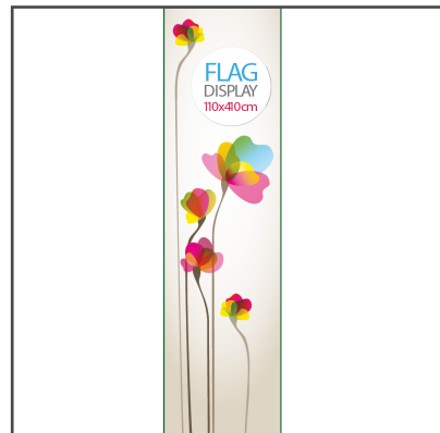
Fișier greșit (produsul a fost redimensionat).